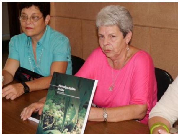
Figura 2: Dos de las autoras durante el lanzamiento del libro Macroalgas marinas de Cuba .

Figure 2: Two of the authors during presentation of the book Macroalgas marinas de Cuba .